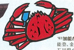
加能かに 能登、金沢、橋立など石川県内で水揚げされたカニのことを「加能かに」と言います。