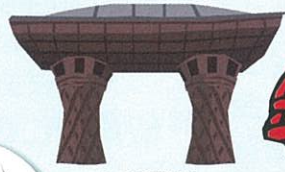
金沢駅鼓門 新しくなったJR金沢駅鼓門は、斬新なデザインで新しいランドマーク。

金沢は、海も山も近いです。車で1時間も走れば、海水浴場へもスキー場へも行く事ができます。また、北陸新幹線も開通し、金沢駅周辺のビル、店舗が非常に充実してきています。休日には隣県からも多くの若い人が買い物に訪れています。米、海産物、日本酒、食べ物全般に美味しいです。回転すしのレベルも高いと言われますね。そして“水”も美味しいかと(水道水そのまま普通に飲めます)。あと、金沢カレー、第7ギョーザ、ハン돈ライスといったB級グルメも、ハマりますね。