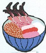
海鮮丼 日本海の豊かな海産物をめいっぱい盛りつけています。