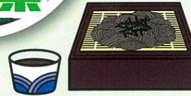
信州そば 各店でそばの味、だしの味も異なり、長野に住む人はそばの味にうさく、お気に入りのそば屋さんがあります。春は、山菜の天ぷらそばといただく蕎麦は最高です。