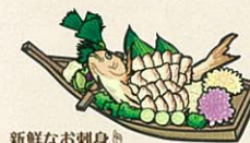
新鮮なお刺身 日本海の綺麗な海でとれた新鮮なお刺身も新潟の魅力の一つです。