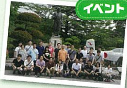
社員旅行は過去にベトナム、東京、九州へ行きました。今年も北陸新幹線で金沢へ。

あがたグローバル税理士法人 Think Globally, Act Locally