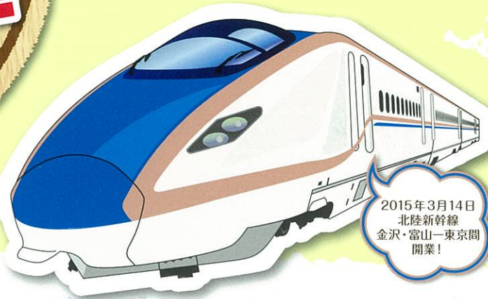
JR西日本 北陸新幹線 [W7系]

就職先はどこを選ばいいのか、悩んでる方は多いはず。 勤務地で選ぶのか、勤務条件で選ぶのか、仕事内容で選ぶのか… それぞれの、地域にも食べ物がおいしかったり、美しい景色があったりと良いところ、みんなに自慢したいことがたくさんあるものです。 今回は北陸新幹線が開通したばかりのエリア、石川県・長野県・新潟県の事務所を紹介。 是非みなさんの就職活動のヒントにしてください!