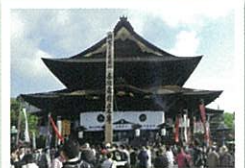
善光寺 642年創建の日本屈指のお寺です。7年に一度の御開帳ではたくさんの参拝客で賑わいます。