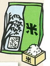
魚沼産コシヒカリ 米所で知られる新潟の代表米といえばコシヒカリ。中でも魚沼産のコシヒカリは良質で高い評価を得ています。

税理士法人近藤まこと事務所 TKC PURE HEART SURE BUSINESS