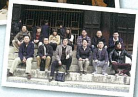
新年会、忘年会、社員旅行が定期イベントです。その他あれこれ理由をつけて、よく飲み会が開催されます。